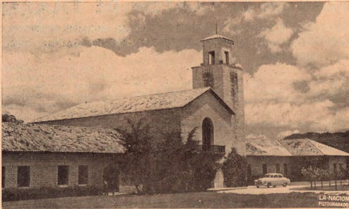
Medio a medio del valle de El Zamorano, en el centro de Honduras, está la Escuela Agrícola Panamericana de El Zamorano, en donde el próximo mes gradúase un grupo de jóvenes costarricenses, después de tres años de estudios disfrutando de becas que da esa Escuela que sostiene la United Fruit Company desde 1943 y es un modelo en su género.

Nota: para conocer la música rogamos a quienes deseen obte- nerla, dirigirse a la dirección de la revista.