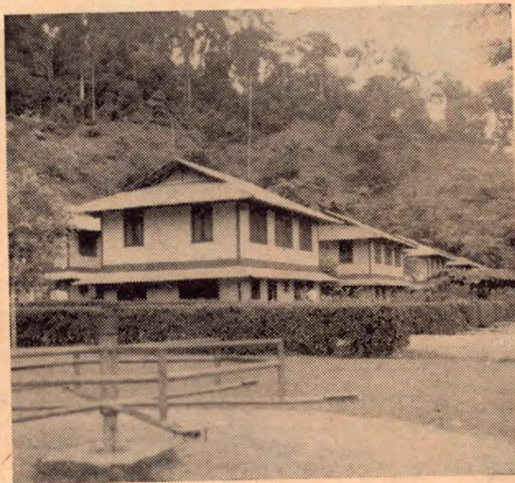
Estas son algunas de las muchas edificaciones que se alzan en Kilómetro 1, o simplemente "El Kilómetro" parte muy importante de la larga población porteña de Golfito.

Pero la tenaz oposición de los indios a permitir el establecimiento del conquistador español en las tierras del Guaymí, no calmó las ansias y ambiciones de éstos, y durante varias centurias fueron muchas las veces en que el indio pagó cara su negativa, "las intenciones de entrada o de incursiones del blanco. En 1566 Perafán de Ribera adentrándose por Boca Coronado, aguas arriba del Terrabá fundó la colonia de Nombre de Jesús, también de vida efímera, en un intento de someter a los coctus. En 1577 don Diego Artieda y Cherinos preparó y llevó a cabo otra expedición al Valle del Guaymí, fundando la ciudad de Artieda del Nuevo Reino de Navarra, que como las anteriores poblaciones que fundaron los españoles en esa zona, corrió la misma mala suerte de sus antecesoras.