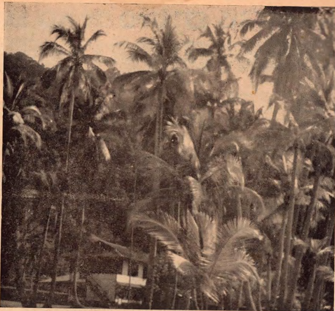
El mar rugie encrespado sobre los arrecifes que circundan a la isla del Caño, la enigmática isla que a pocas millas de la costa sureña, fué el panteón de los antiguos pobladores aborígenes. Grandes entierros y sepulturas se han encontrado en esa isla, de la cual viene aquí, con la esplendidez de un maravilloso paisaje tropical, este retiro, cerca de la costa por la única zona por donde es fácil llegarse al interior de la isla.

La primera alusión que para el mundo exterior se hace de Golfo Dulce, se debe al francés Maury de Lapeyrouse en 1850, quien a-