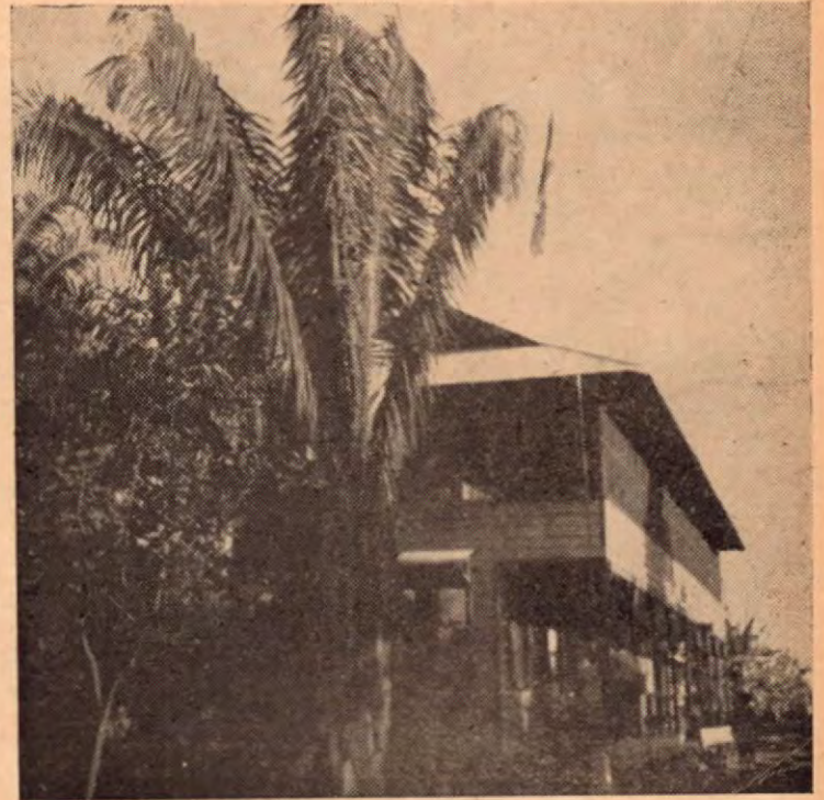
Esta foto, muestra la Casa de las Autoridades Costarricenses y Panameñas en el "Puesto" de González Viquez, en la frontera sur. Allí, un tabique, señala la frontera: esta parte Panamá, esta otra Costa Rica. Pero las autoridades fraternizan como fraterniza en los pueblos tico y panameño.

A su vez, la necesidad de poder tratar con la Compañía Bananera que venía a inyectar a la economía endeble de estos países, el fuerte caudal de sus millones y