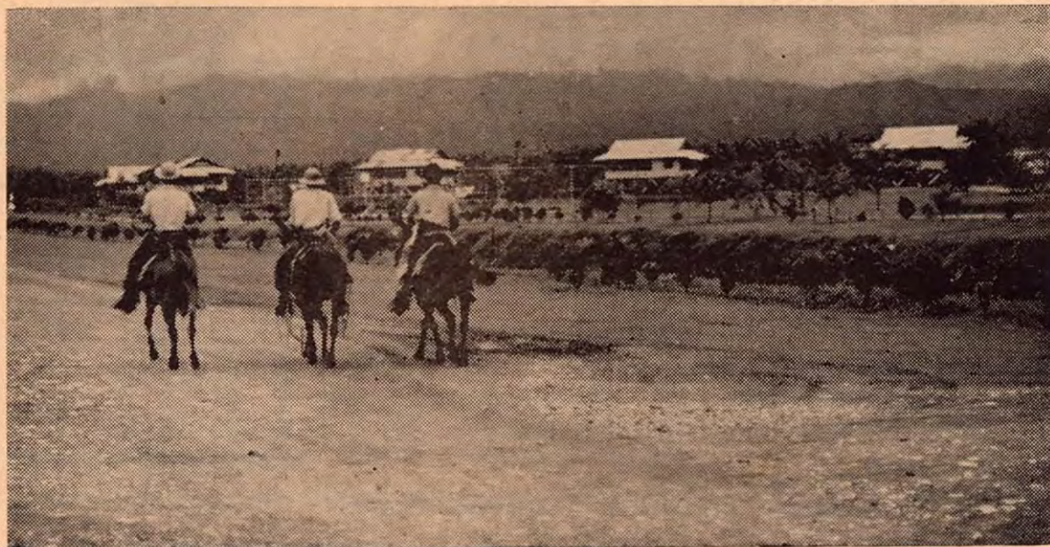
El valle maravilloso del río Coto es como una bendición para el país. Las tierras selváticas se han transformado en inmensas fincas de banano por la tenaz acción de la Compañía Bananera de Costa Rica. Aquí vemos una visión de atardecer. Los agricultores, a caballo, llevan ruta a uno de los coquetos poblados de ese valle prodigioso.

Le ofrecemos en la capital una casa familiar para hospedarse.